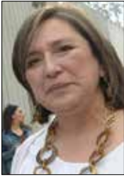
Bertha Xóchitl Gálvez Ruiz Jefa delegacional en Miguel Hidalgo 2015-2018

Ingeniera en Computación por la Universidad Nacional Autónoma de México, con especialidades en robótica, inteligencia artificial, edificios inteligentes, sustentabilidad y ahorro de energía. Se desempeñó como jefa delegacional en Miguel Hidalgo. Ha ocupado diversos cargos, entre ellos directora general de la Comisión Nacional para el Desarrollo de los Pueblos Indígenas y titular de la Comisión de Desarrollo de los Pueblos Indígenas. Creó la Fundación Porvenir, que apoya a niños con desnutrición en zonas indígenas del país, y la empresa High Tech Services, especializada en el diseño de edificios inteligentes. Fue promotora de la reforma constitucional en materia de derechos y cultura indígena y de la Ley General de Derechos Lingüísticos de los Pueblos Indígenas . Asimismo, impulsó una política de sustentabilidad y movilidad en Miguel Hidalgo. Recibió el Premio a la Empresaria del Año, el Premio Global de Liderazgo Femenino, y fue reconocida como la primera mujer mexicana en formar parte de la lista de los 100 Líderes Globales del Futuro. Actualmente es senadora de la República en la LXIV Legislatura.