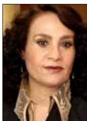
Dolores Padierna Luna Jefa delegacional en Cuauhtémoc 2000-2003

chos Humanos. También fue diputada federal en dos ocasiones: en la LIX Legislatura, donde integró las comisiones del Distrito Federal, Ciencia y Tecnología, Gobernación y Puntos Constitucionales y Desarrollo Metropolitano; y en la LXII Legislatura, como presidenta de la Comisión de Cultura y Cinematografía. Además fue titular de la Delegación Sur del Instituto Mexicano del Seguro Social en el Distrito Federal; así como subdirectora de la Coordinación de Regiones del Fideicomiso para el Ahorro de Energía Eléctrica. Es diputada local en el Congreso de la Ciudad de México I Legislatura.