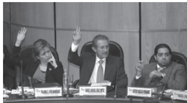
• Aspecto de la sesión de Consejo General del IEDF celebrada el 24 de octubre de 2008

El texto íntegro de estos acuerdos se puede consultar en el Centro de Documentación del IEDF, ubicado en Huizaches núm. 25, col. Rancho Los Colorines, del. Tlalpan, México, D.F. o en el sitio de internet del Instituto www.iedf.org.mx