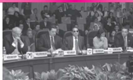
• Los partidos políticos contarán con un Catálogo de proveedores de bienes, servicios y arrendamientos