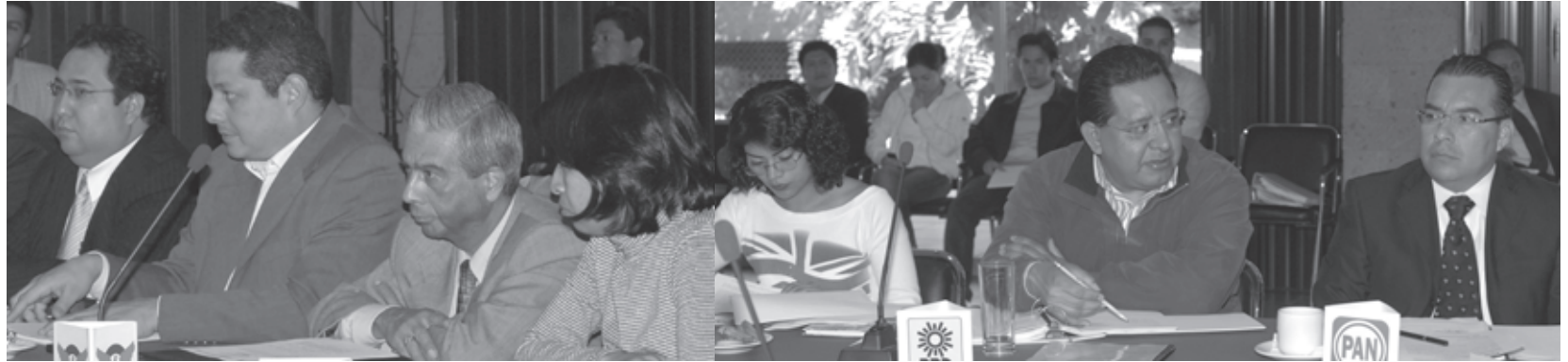
• Los representantes de los partidos políticos con registro ante el IEDF son portavoces de las diferentes expresiones políticas en el DF

LOS CIUDADANOS DEL DISTRITO Federal se han caracterizado por tener una participación política superior al promedio nacional. Por tanto, resulta imprescindible la existencia de partidos políticos locales, los cuales ofrecerían espacios a las diferentes expresiones políticas, derivadas de la compleja diversidad del Distrito Federal.