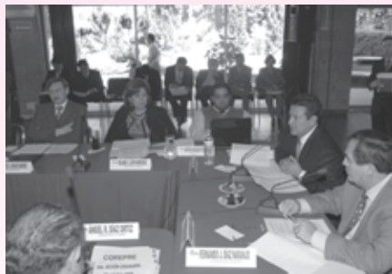
• Reunión de trabajo del COREPRE

Es por ello que cualquier tendencia que de manera oficial reporte el Instituto Electoral del Distrito Federal (IEDF) en las elecciones locales, deberá ser oportuna, confiable, objetiva y certera, a fin de aclarar toda duda sobre el sentido de la votación, de manera que, cuando la información recabada