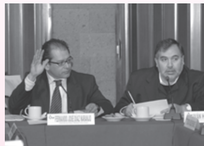
• Reunión de trabajo de la COYGE

En este momento, en el IEDF se encuentra en desarrollo la primera etapa del proceso electoral: la preparación de la elección, en la cual, durante lo que resta del presente año, se llevarán a cabo diferentes proyectos que, a partir del mes de enero próximo, irán dándole forma a la organización de las elecciones, como dispone el Estatuto de Gobierno del Distrito Federal . El próximo año se instalarán los consejos distritales, se desarrollarán, en su caso, los procesos de selección interna de candidatos en los partidos políticos y, posteriormente,