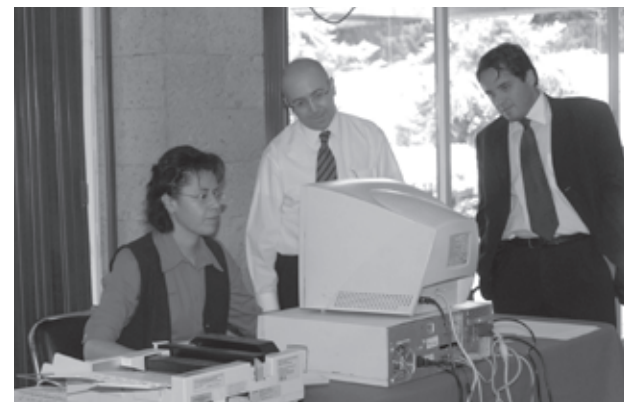
• Aspectos del Primer concurso interno para ocupar vacantes del SPE

Los funcionarios ganadores del Primer Concurso Interno para ocupar vacantes del Servicio Profesional Electoral en los Órganos Desconcentrados se enuncian enseguida: