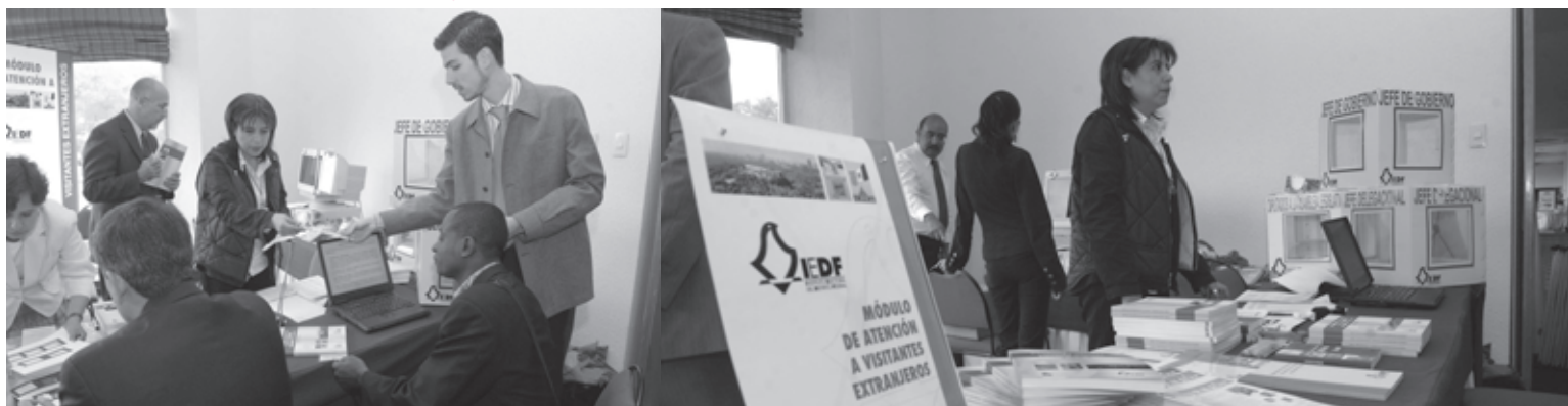
• Aspectos del módulo de atención a visitantes extranjeros que se instaló en el Proceso Electoral Local 2006

Finalmente, cabe señalar que en el anexo técnico que se suscriba con el IFE, con motivo de la elección concurrente de 2009, se acordará lo relativo a la acreditación y presencia de los visitantes extranjeros acreditados por ambos institutos ■