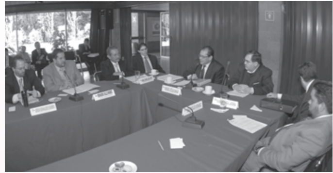
• Integrantes de la COYGE

*Consejero electoral del IEDF y presidente del COREPRE 2009