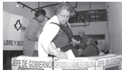
• El IEDF inició los trabajos para que los ciudadanos acudan a votar el 5 de julio de 2009

En esta primera etapa, el Instituto, al dar el banderazo de salida, se constituye como garante para que se realicen elecciones libres y auténticas, mediante sufragio universal libre, secreto, directo, personal e intransferible, a través del cabal cumplimiento de sus principios rectores de certeza, legalidad, independencia, imparcialidad, objetividad y equidad ■