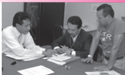
• Registro de proveedores para inscribirse en el catálogo

• Simplificará el ejercicio de fiscalización de la autoridad electoral local y facilitará el cumplimiento del perio-