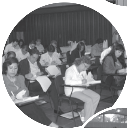
• Aspectos del concurso para cubrir vacantes del SPE