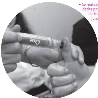
• Se realizarán actividades para la jornada electoral del 5 de julio de 2009