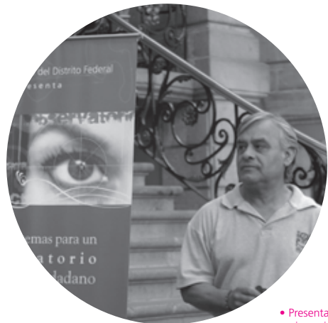
• Presentación de publicaciones institucionales

SE PRESENTAN las principales actividades que se realizarán en el Instituto en el último bimestre del año en curso.