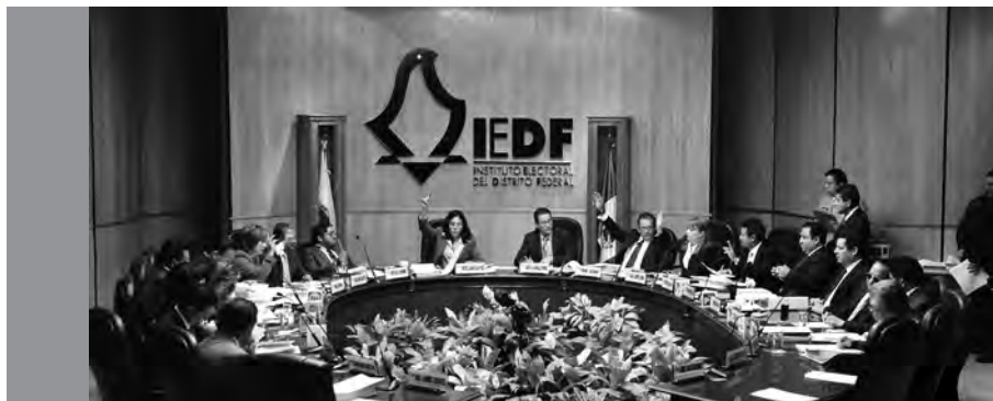
El Consejo General es el órgano superior de dirección del Instituto.

El órgano superior de dirección se integra por un consejero presidente y seis consejeros electorales (con derecho a voz y voto), un secretario del Consejo y los representantes de los partidos políticos (con derecho a voz), así como un integrante de cada grupo parlamentario con representación en la Asamblea Legislativa del Distrito Federal (ALDF), que serán aprobados por su Comisión de Gobierno. 1