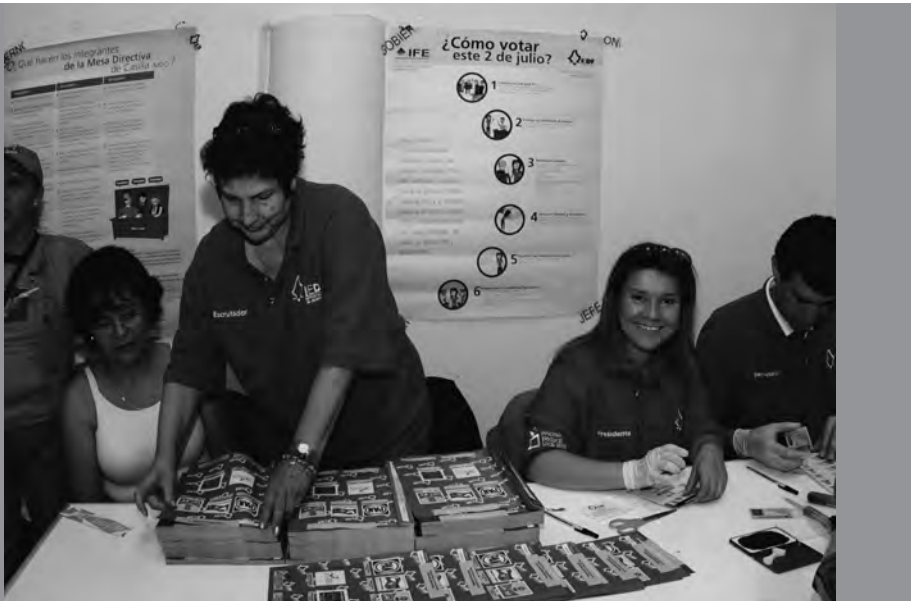
Ciudadanos que integraron las MDC en el Proceso Electoral Local Ordinario 2006.