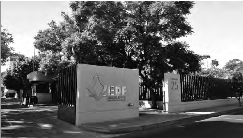
Entrada principal de las oficinas centrales del IEDF.