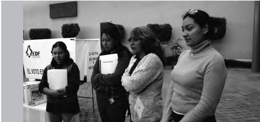
Observadores electorales registrados para la jornada electoral del 2 de julio de 2006.

Los consejeros presidentes presentarán las solicitudes al Consejo General y los consejos distritales, según el caso, para ser aprobadas en la siguiente sesión que celebren. La resolución deberá ser notificada a los solicitantes. El Consejo General garantizará este derecho y resolverá cualquier planteamiento que pudiera presentarse por parte de los ciudadanos o las organizaciones interesadas.